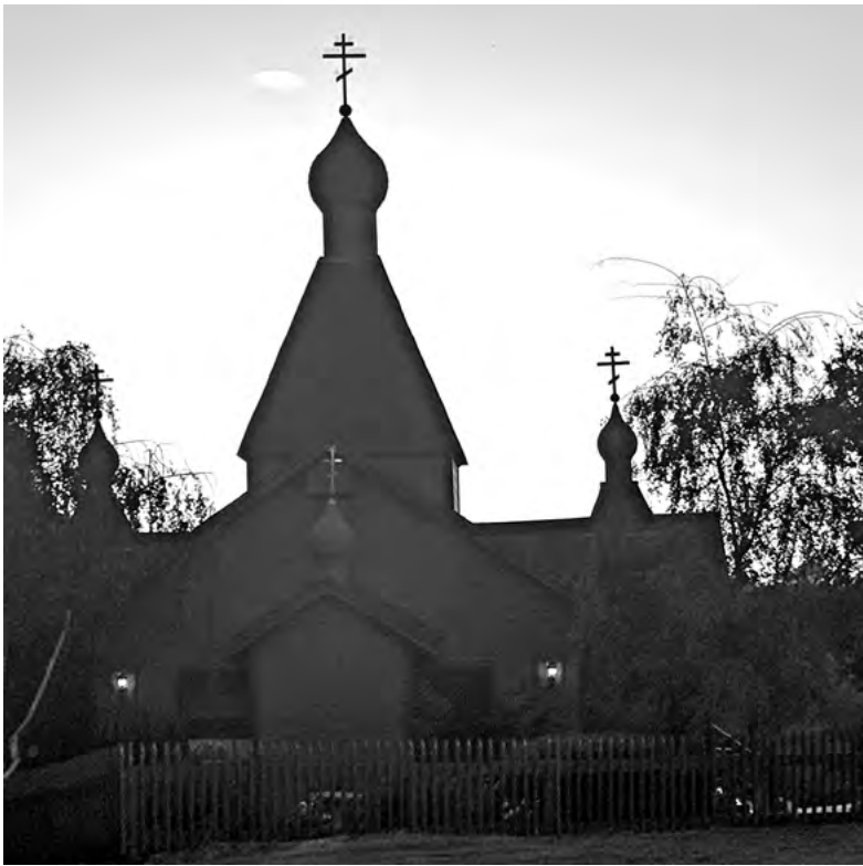
Храм преподобного Серафима Саровского

и пополнения. Молодые американцы принимают крещение, регулярно приходят на службы, поют на клиросе, прислуживают в алтаре. И мы почаще начинаем служить на английском языке. В воскресный день в среднем у нас причащается человек 60, может, даже больше.